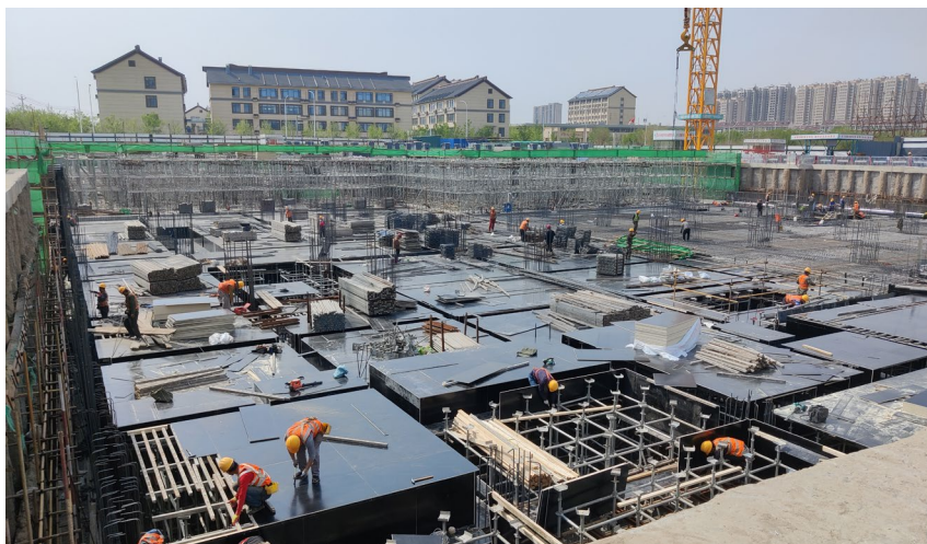
▲ 通州区档案馆新馆建设现场

【公务活动保障】 2022 年，区机关事务服务中心完成中共北京市通州区代表会议、区人大二次会议、区两会、副中心高质量发展推进大会、区委全会等 15 次重要会议以及北京冬奥会观赛、国家及市区重大专项调研、市委巡视组专项巡视、市审计组专项审计、市安全生产督察、市第二轮环保督察、市行政办公区二期搬迁等重大活动服务保障任务。保障区纪委区监委机关、区委组织部、区政府办等部门资产调配需求 28 次，涉及办公家具、办公设备 137 件，其中循环调剂使用 67 件次；保障上级机关到通驻通专项督导、督