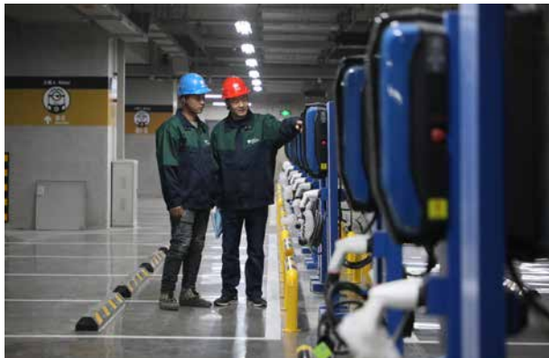
10月22日，通州供电公司工作人员开展环球影城充电桩检查工作

面对两轮次疫情冲击，第一时间响应国家号召。建立“火速接电绿色通道”，郎府医院、白庙检查站等重点防疫站点配套工程均提前竣工送电。第一时间落实国家“降低工商业电价5%”政策，全年减免大工业、一般工商业企业电费。实施疫情防控期间居民欠费不停电，惠及客户67.9万户。提升优质服务管理水平。健全接诉即办机制，整合全渠道各业务工单管理，实现接单、派单、预警、督办、回单全流程闭环管理，客户投诉降低69.39%，“12345”排名保持前列。有力开展综合能源建设。超额完成综合能源全年1700万元营收指标，形成城市副中心特色的“1+1+N”体系工作成果。编制《北京城市副中心重点区域综合能源规划》，搭建数字孪生的信息物理系统，开展多项“供电+能效”服务示范工程。推进营销重点项目建设，在环球度假区建成现状最大规模的智慧充电站，共计901个充电桩，融合有序充电、车联网平台，满足客户灵活充电需求，为园区提供光伏车棚、储能电站等服务。