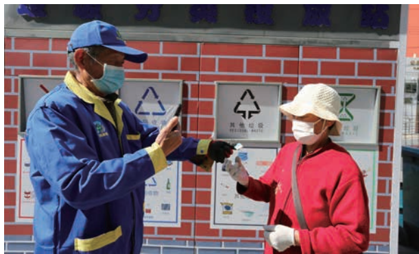
在北苑街道投用的垃圾分类投放站前，垃圾分类指导员为市民指导如何使用通州区垃圾分类系统“潞晓分”进行正确分类 (区域管委提供)

挥部，全面推进各项工作进程。通过搭建生活垃圾分类移动端“潞晓分”、科学设置集中投放分类桶、专人值守、强化公开公示、厨余垃圾专收专运等多举措，科学有序推进垃圾分类工作的落实。全年开展联合执法检查 3061 场次，发放垃圾分类宣传手册 46.8 万余本，开展宣传活动 13240 余场，入户宣传 11340 余场，活动辐射 276.5 万余人次；原有桶站 6328 座投放点，撤并至 3871 座，撤并率 38.8%；市级 480 座驿站建设完成 301 座，149 台车辆和 21 座密闭站全部完成升级改造；志愿者、小巷管家、在职干部职工等多方力量值守，确保桶前值守全覆盖，有效提升垃圾分类居民参与率和正确投放率，分别达到 91.5%、79.38%。