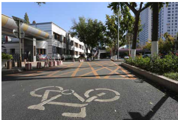
学校周边交通环境治理

【重点区域环境综合提升工程】 2020 年，开展潞河中学周边区域环境综合提升工程，涉及周边 17 栋楼 1127 户，建筑面积约 8.5 万平方米，截至年底完成总工程量的 60%；开展文化旅游区周边环境综合提升工程，主要涉及太玉园东区，小区占地面积 15.34 万平方米，共计 43 栋楼 3575 户，建筑面积约 29 万平方米，截至年底完，成总工程量的 40%；完成“三庙一塔”周边环境整治提升工程，工程占地面积约 5000 平方米，共粉饰建筑立面 1551.02 平方米，围墙围栏粉刷 1373.87 平方米，绿化用地整理 5180.2 平方米，绿化种植乔木 135 株、灌木 133 株、其他矮灌木及地被种植 4670 平方米，灌溉管线敷设 271.5 延米，地面铺装硬化 740.03 平方米，利用拆违后空地完成居民休闲活动口袋公园 1 处。