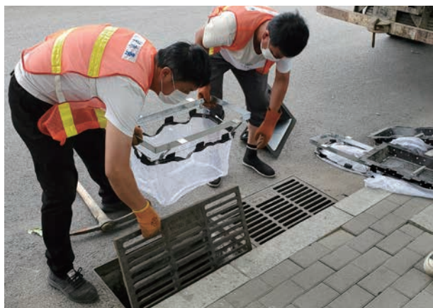
6月，供排水事务中心雨水口安装垃圾截流装置及防臭截污装置

出的管道破裂、腐蚀异物穿入、变形的结构问题进行非开挖整段修复(FIPP)，该工程修复管径D400排水管线511米，有效保障了排水管线的使用功能和管道内部结构完整。安装垃圾截流装置。安装垃圾截流装置5941套，有效避免地面垃圾、污物随着雨水冲刷流入河中，造成水体污染。