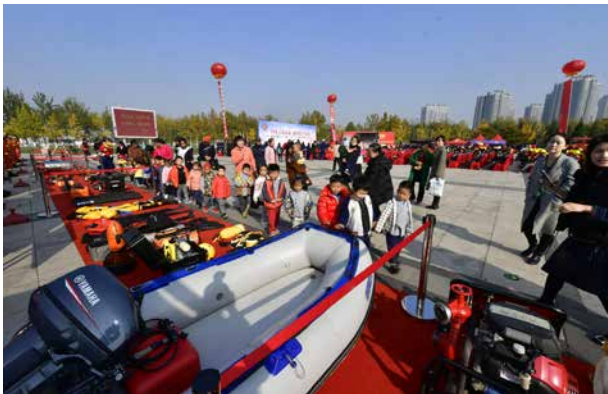
“119”消防宣传月系列活动

【强化实操实训】 2020年,对“一警六员”强化实操实训,制作移动式消防栓、简易火盆14套,对503家单位7000人完成消防栓“出真水”、灭火器“灭真火”实操实训考核,巩固基层消防安全力量。