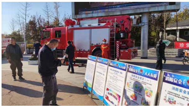
11月8日,协会与西集镇安监科联合组织消防安全宣教活动,群众参观流动展览

2020年,为更好地配合全区119消防宣传工作部署,协会在疫情有所缓解的形势下,确保参展人员做好安全防护并保证人员不密集的前提下,继续秉承协会“点”“面”结合和“送展上门”的组展方针,在马驹桥物流、北京工业大学、北京财贸学院、潞河医院等防火重点单位和西集、张家湾、漷县、中仓4个基层活动片组中组织消防安全流动展览和消防安全知识义务咨询等活动,受教育人数51740人次,有效普及消防安全知识,推进会员单位消防安全工作水平的提升,对从业人员的综合素质起到良好的推动作用。