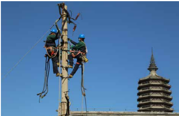
10月30日，通州供电公司工作人员开展老城区电力架空线入地作业

【营销与优质服务】 营业区域内，2020年底拥有客户73.37万户，其中第一产业0.27万户，第二产业0.62万户，第三产业5.10万户，居民客户67.38万户。累计完成高压接电容量83.26万千伏安，完成“三零”（零上门、零审批、零投资）服务8236项，节省客户投资2800万元，其中小微企业接电375项。完成“三省”（省力、省时、省线）服务送电18项，节省客户投资625万元。