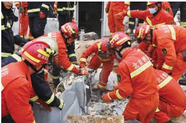
“711”宋庄房屋倒塌，指战员正在抢救被困人员

高效遂行各类灭火和应急救援任务 2823 起，其中，火灾扑救 1507 起，抢险救援 965 起，社会救助 351 起。累计出动消防车 6935 辆次、指战员 36507 人次，营救遇险群众 246 人，疏散被困人员 51 人，直接抢救财产价值 53.1 万元。