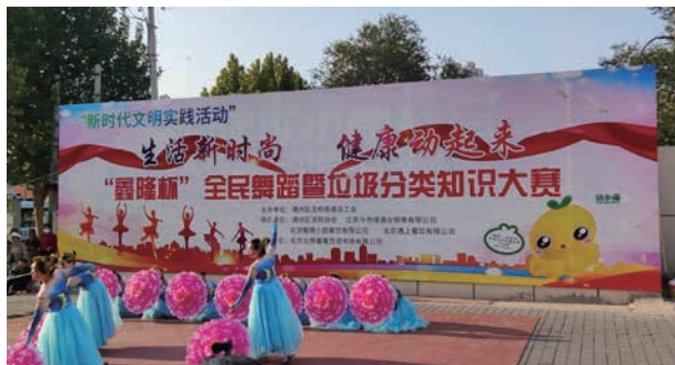
9 月 12 日，协会协助北京众想鑫隆百货市场有限公司开展“鑫隆杯”全民舞蹈暨垃圾分类知识大赛活动

周承维出席开幕式并发言。此活动为期 5 天，仅在公休日进行，持续组织了 5 场次，有 18 支代表队的 236 人参与活动。活动不仅树立和强化了垃圾分类等环保理念，同时普及了家庭用电、用气等消防安全知识。使社会群众和社区居民在载歌载舞中学到消防知识，得到参赛人员和参观人员的热烈欢迎。是月，协会参与北京消防协会“中德启锐杯”首届 119 消防知识竞赛公益活动，全市诸多行业的 26 支代表队参加竞赛，经过网上注册、填报相关资料、并进行网上的初赛，包括通州区消防协会的 11 支代表队在初赛中脱颖而出。在 11 月 6 日举行的现场决赛中，协会获得优秀奖。11 月 8 日，协会与西集镇安监科联合组织消防安全宣教活动，协会秘书长周承维宣讲火灾预防和初期火灾扑救以及避险逃生等消防知识，并向参加活动的农村群众发放“自我保护掌中宝”“消防安全进农村”等宣传册 300 余册，