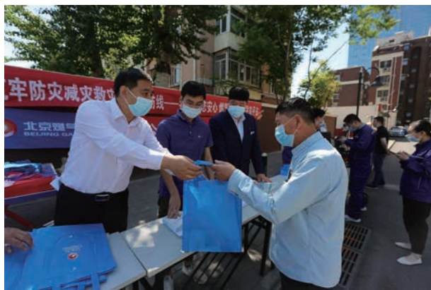
做好疫情防控前提下，开展防灾减灾日燃气安全宣传活动

【燃气安全宣传培训】 2020 年，利用录制视频、下发电子文件材料形式对通州区燃气企业进行安全学习培训 2 次，开展燃气安全宣传进社区、进企业活动 6 次，向农村“煤改气”居民发放《安全使用手册》5.5 万份，组织燃气企业开展应急演练 15 次，切实提升燃气企业处置突发燃气事故能力。