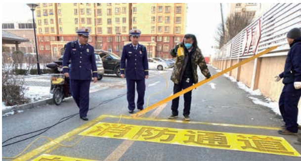
1 月 8 日，通州支队联合属地政府开展打通“生命通道”治理行动

【隐患综合治理】 2020 年，以消防安全专项整治三年行动为抓手，开展施工现场、打通生命通道、厂库房、电动自行车等领域的专项整治，累计检查单位 1.56 万家，发现隐患 2.09 万余处，罚款 528.87 万元，查封 280 家，“三停”（停产、停业、停止使用）123 家；对潮县、马驹桥等厂库房密集区域开展 5 波次的检查，“两断三清”（断水断电、清设备清产品清原料）102 处、疏散清退 9 处、媒体曝光 11 处，推动 90% 以上的居民小区完成消防车通道标识划线。