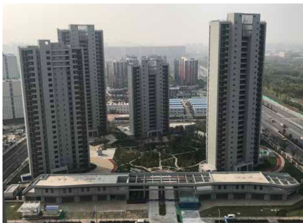
台湖公租房

【台湖公租房一、二标段建成】 工程位于通州区台湖镇两站一街区域,总建筑面积约40.2万平方米,包括1#-11#、14#-18#、27#-42#公租房,19#-26#、43#-49#配套公建,P1、P2、P4-P7配电室,C1、C2、C4-C8地下车库。公租房地下1层至地下2层、地上14层至28层,装配式剪力墙结构;配套公建及配电室地上1层至3层,框架剪力墙结构。工程总投资约16.5亿元。2016年7月开工,2019年9月实体工程基本完成。北京市保障性住房建设投资中心建设,中国建筑设计研究院有限公司、北京市建筑设计研究院有限公司设计,北京城乡建设集团有限责任公司、北京城建集团有限责任公司施工,中船重工海鑫工程管理(北京)有限公司监理。