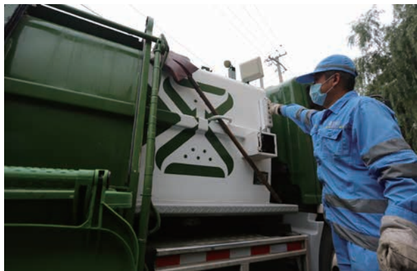
环卫工人正在对厨余垃圾分类进行打分

【生活垃圾末端处理】 2020 年，全区日均产生其他垃圾约为 1522.96 吨，厨余垃圾约为 249.44 吨，粪便约为 233.06 吨。其中，其他垃圾统一进入再生能源发电厂进行无害化焚烧处理，全年无害化处理原生垃圾 55374.81 吨；厨余（餐厨）垃圾除马驹桥镇、台湖镇（上述两镇进入董村综合处理厂消纳处理）外统一进入有机质资源生态站进行生化无害化处理，随着 5 月 1 日垃圾分类工作的实施，通州区厨余垃圾量出现明显增幅，全年处理厨余（餐厨）垃圾 92265.31 吨，产沼 4761150.8 立方米；粪便垃圾统一进入有机质资源生态处理站进行厌氧发酵无害化处理，全年无害化处理粪便垃圾 85145.65 吨。