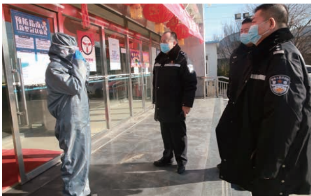
2 月 18 日，交通支队到白庙检查站检查疫情防控情况

【疫情防控】 2020 年，严格执行“内防扩散、外防输入”总体思路，以外围检查站为依托，加强与治安、防疫等部门沟通配合，强化进京车辆盘查核录。疫情初期，共核查湖北籍车辆 109 辆、湖北籍人员 700 余人，劝返不合格车辆 1800 余辆。强化落实专项疏导措施，按照“一岗一策”的工作要求，加大警力投入，做好管界医院、隔离点、疫苗接种点周边交通秩序维护疏导工作。